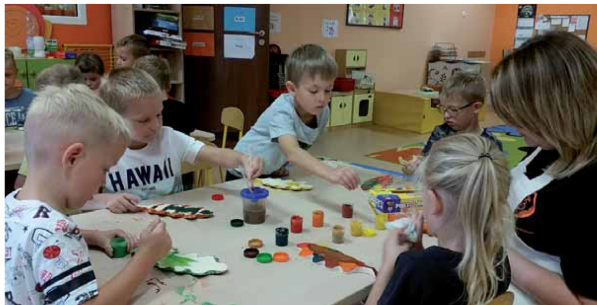
236 nowych miejsc dla przedszkolaków będzie dostępnych od września w gminnych placówkach.