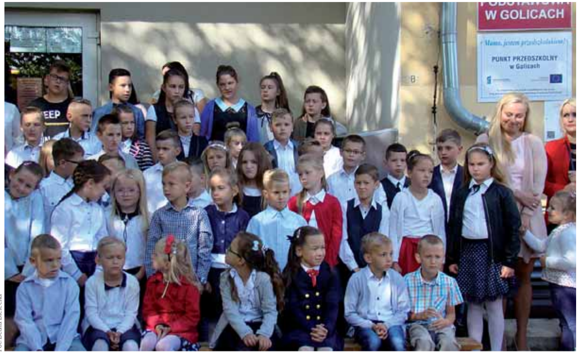
W Szkole Podstawowej w Golicach na dzieci spoza obwodu czeka 16 miejsc. W sumie w gminie takich miejsc jest 43.